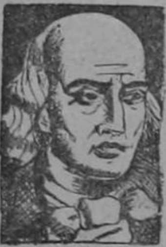
BENJAMIN FRANKLIN (1706-1790)

En Boston, hoy populosa ciudad de los Estados Unidos de América, nació Benjamín Franklin, uno de los hombres más sabios del siglo XVIII, y justamente acreedor a la gratitud de la Humanidad. A su profundo talento, a su maravillosa actividad y a su aplicación constante se debe en gran parte el progreso del arte de imprimir, y en absoluto la invención del pararrayos; así como a su heroico patriotismo y a su diplomacia sagaz, la independencia de la Nueva Inglaterra, que difícilmente hubiera conseguido sin su eficaz concurso el heroísmo de su amigo Washington. Murió en