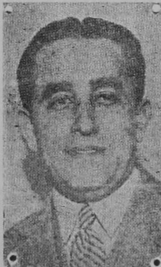
Don Miguel Mariano Gómez

HABANA, 24. UP.—La UNITED PRESS se anotó anoche otro triunfo al anunciar primero a todos los periódicos del mundo la destitución del presidente doctor Miguel Mariano Gómez del solio presidencial, acto que se produjo cuando el senado sostuvo la acusación contra el primer mandatario de la nación cubana con una votación de veintidos contra doce votos, y siendo necesario un voto de dos terceras partes del alto tribunal únicamente. En la madrugada de hoy el ex presidente Gómez dirigió, desde su residencia en el Prado, el manifiesto que había prometido dirigir a la nación, y el ex mandatario se queja de la injusticia de que ha sido objeto por parte del senado al sostener las acusaciones de la cámara. Con profunda amargura el doctor Gómez sugiere que el coronel Fulgencio Batista debería constituirse en único dictador de la nación para ahorrar los gastos de administración del próximo gobierno que ha de constituirse. Desde las horas de la mañana se están haciendo todos los preparativos para la ceremonia del juramento del licenciado Federico Laredo Bru, acto que se efectuará almedío día de hoy.